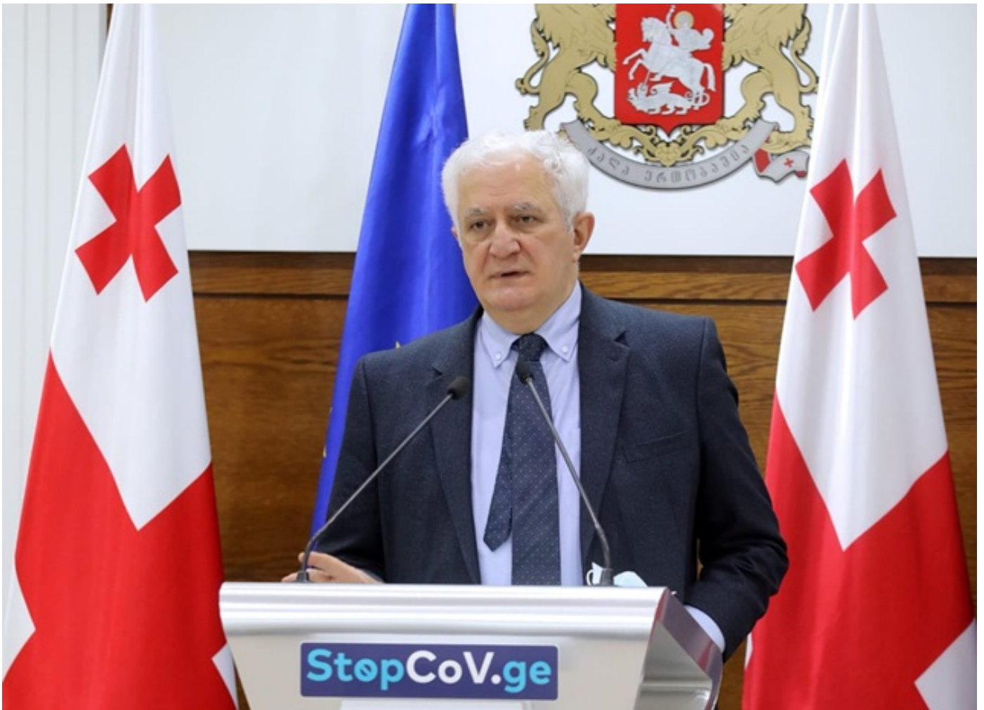
ამირან გამყრელიძის თქმით, საქართველოში სიკვდილიანობის მაჩვენებელი შემცირდა