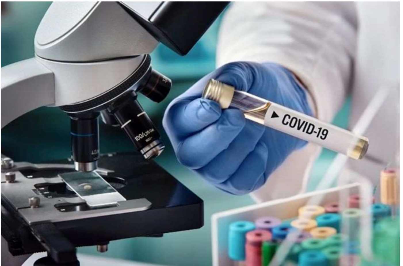
სკოლებში, სადაც სწავლა საკლასო ოთახებში განახლდება, მასწავლებელთა და სკოლის ადმინისტრაციული პერსონალის მინიმუმ 20% ორ კვირაში ერთხელ გაიტესტება