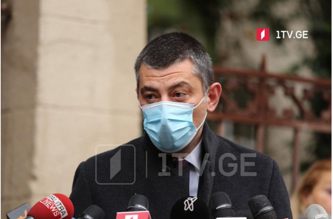
გიორგი გახარია - შებენიანების არასწორი, არაგონივრული და ნაჩქარევი მოხსნა იქნება მიზეზი, რომ შემდგომ ყველაფრის დახურვა მოგვიწიოს