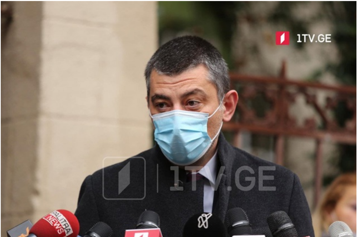
გიორგი გახარია - შებენიანების არასწორი, არაგონივრული და ნაჩქარევი მოხსნა იქნება მიზეზი, რომ შემდგომ ყველაფრის დახურვა მოგვიწიოს