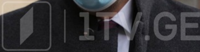
გიორგი გახარია - შებენიანების არასწორი, არაგონივრული და ნაჩქარევი მოხსნა იქნება მიზეზი, რომ შემდგომ ყველაფრის დახურვა მოგვიწიოს