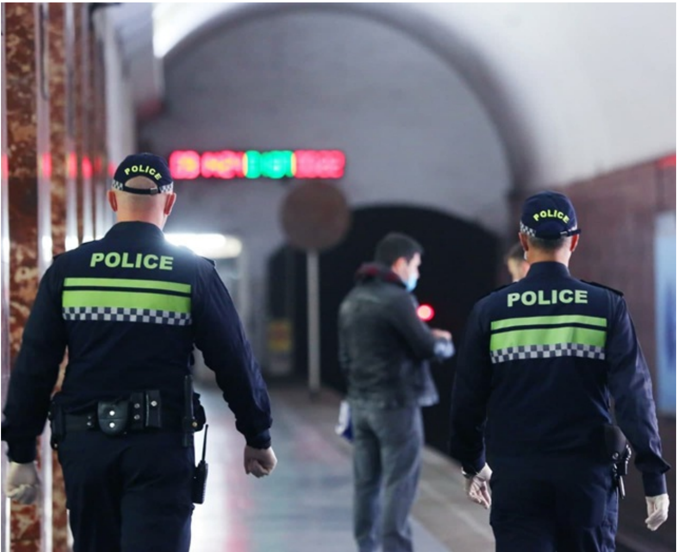
2020 წელს პირბადის ტარების წესის დარღვევის 59 000-მდე შემთხვევა გამოვლინდა