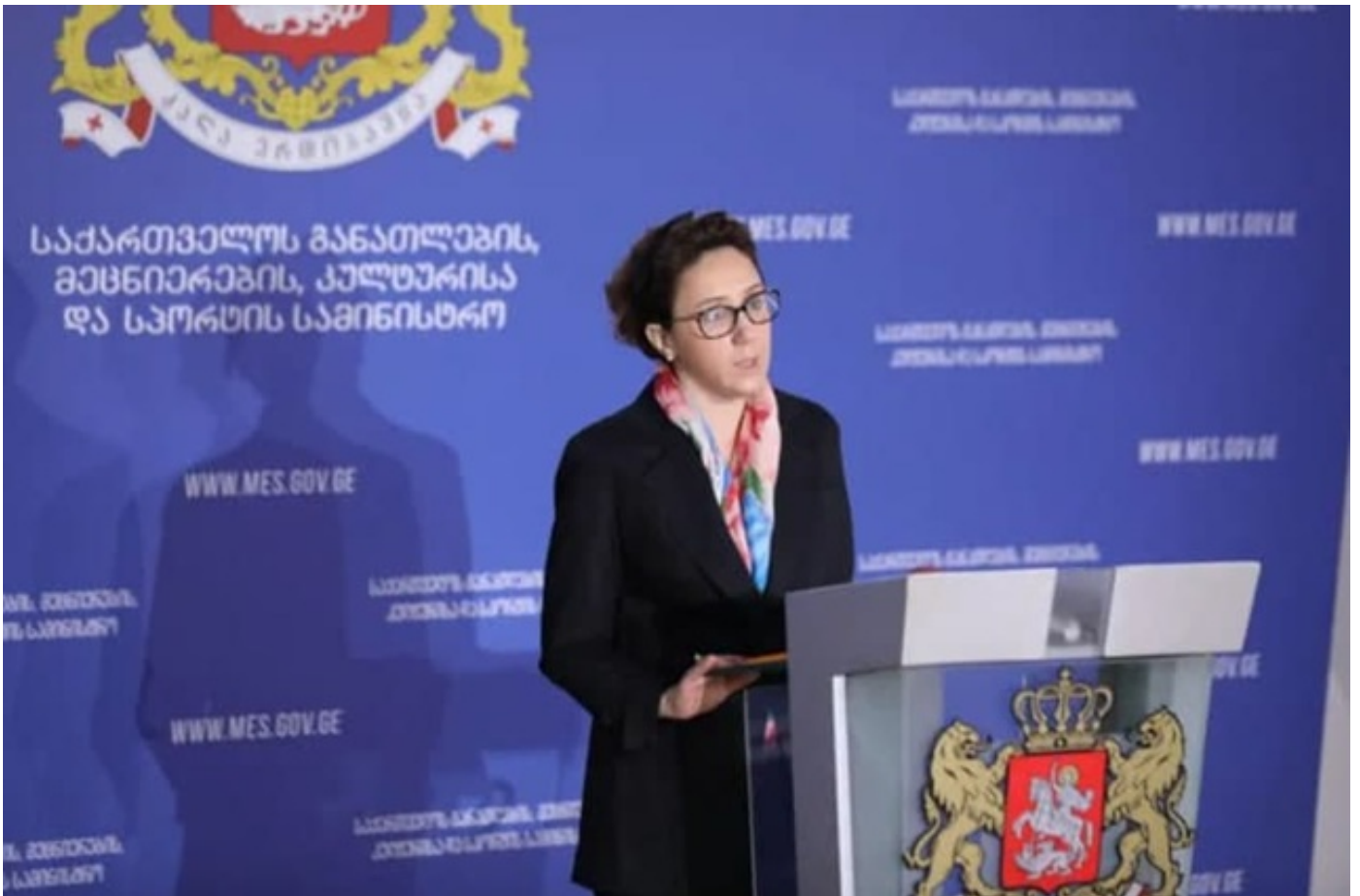
განათლების მინისტრის მოადგილის განცხადებით, 13 ქალაქიდან მოსწავლეთა 12%-მა გამოთქვა სურვილი, რომ სწავლა დისტანციურ რეჟიმში განაგრძოს

Giorgi Gakharia - The safety of students and providing them access to quality education is the government's most important priority Translated