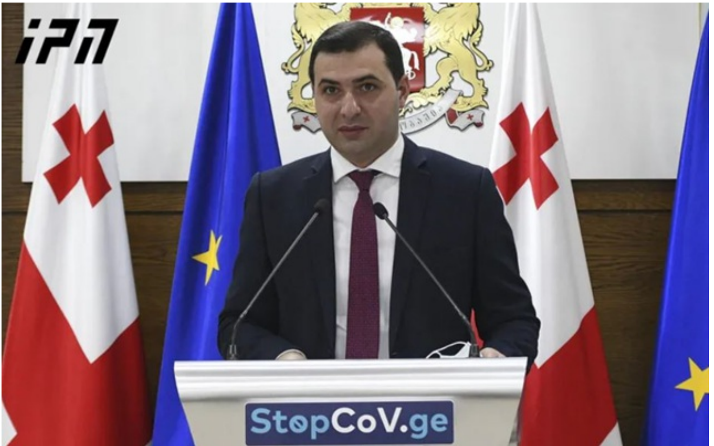
ბექა ფერაძის განცხადებით, პორტალზე რეგისტრირებული 47 მოლიდან გახსნისთვის საჭირო მოთხოვნებს 46 აკმაყოფილებს