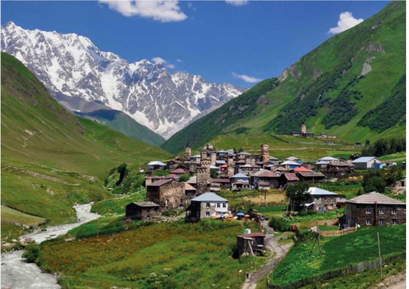
გამოცემა fDi Magazine საქართველოში ტურიზმის განვითარების შესახებ სტატიას აქვეყნებს