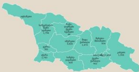
საქართველოში COVID-19 სანაპაოზოლო აგრეგის ჩარიცხულია (NCDC & PH) 4 სექტემბერი, 2021

National Center for Disease Control & Public Health Georgia (NCDC & PH) 21 hours ago