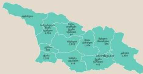
საქართველოში COVID-19 სანაბლოდელი აცრების ჩარიცხვის რაოდენობა 4 სექტემბერი, 2021

National Center for Disease Control & Public Health (NCDC & PH) on Friday