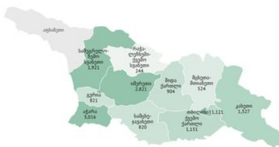
საქართველოში COVID-19 სანიტაზიკაციის ადრების სტატისტიკა

National Center for Disease Control & Public Health, (წლიდან მარტის 19-დან) on Wednesday