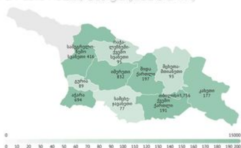
საქართველოში COVID-19 საწინააღმდეგო აცრების სტატისტიკა

National Center for Disease Control & Public Health 14 hours ago