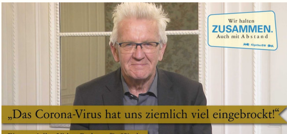
Ein spezielles Video-Projekt für Kinder