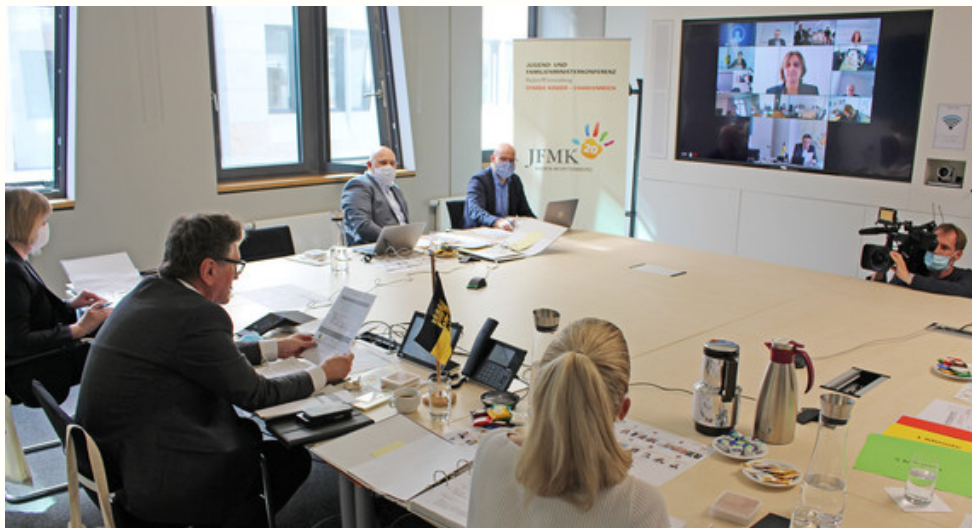
Ministerium für Soziales und Integration