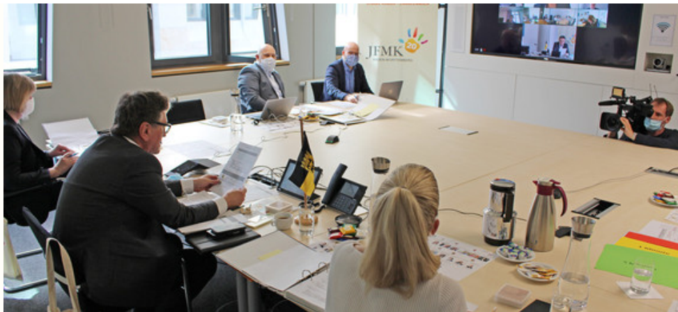
Ministerium für Soziales und Integration