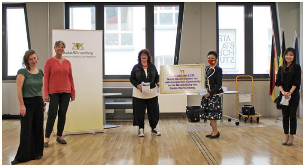
Ministerium für Soziales und Integration