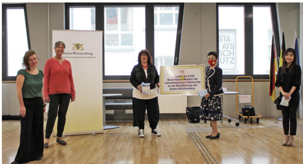
Ministerium für Soziales und Integration