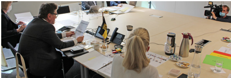
Ministerium für Soziales und Integration