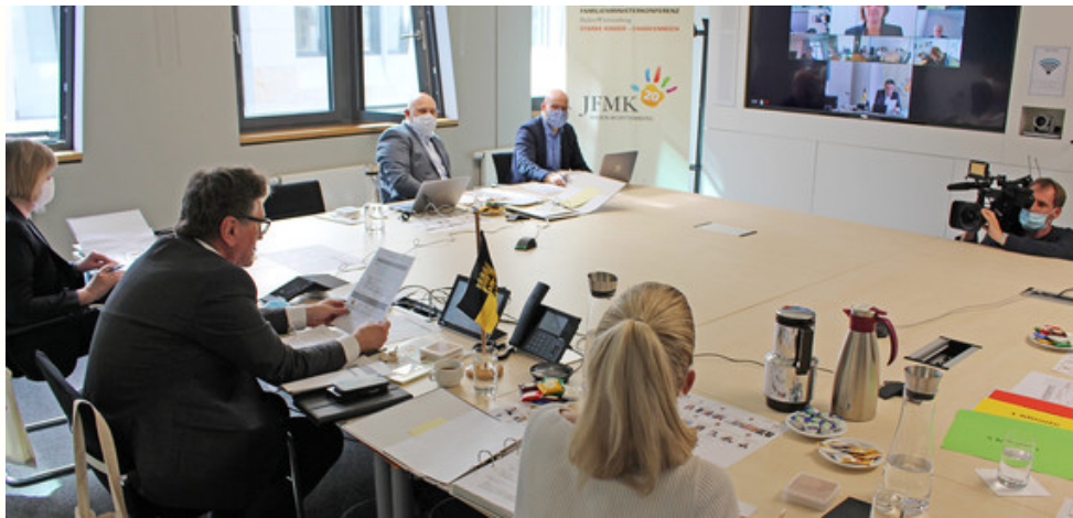
Ministerium für Soziales und Integration