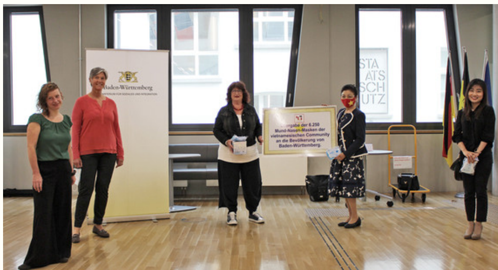
Ministerium für Soziales und Integration