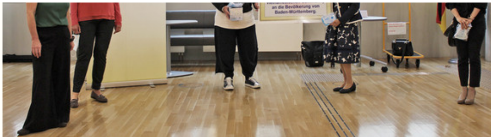
Ministerium für Soziales und Integration