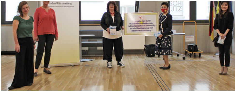
Ministerium für Soziales und Integration