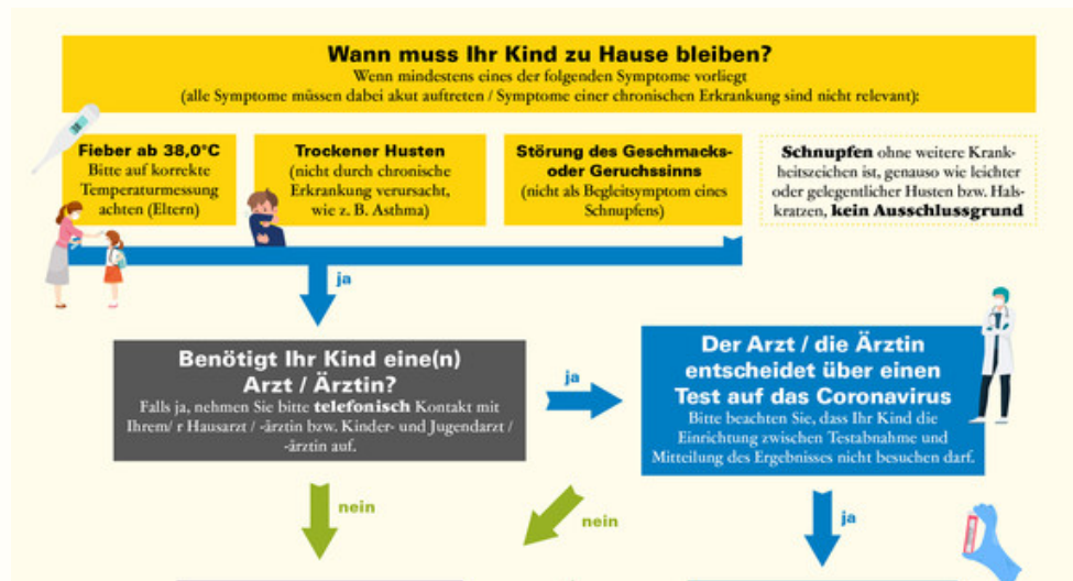
Ministerium für Soziales und Integration