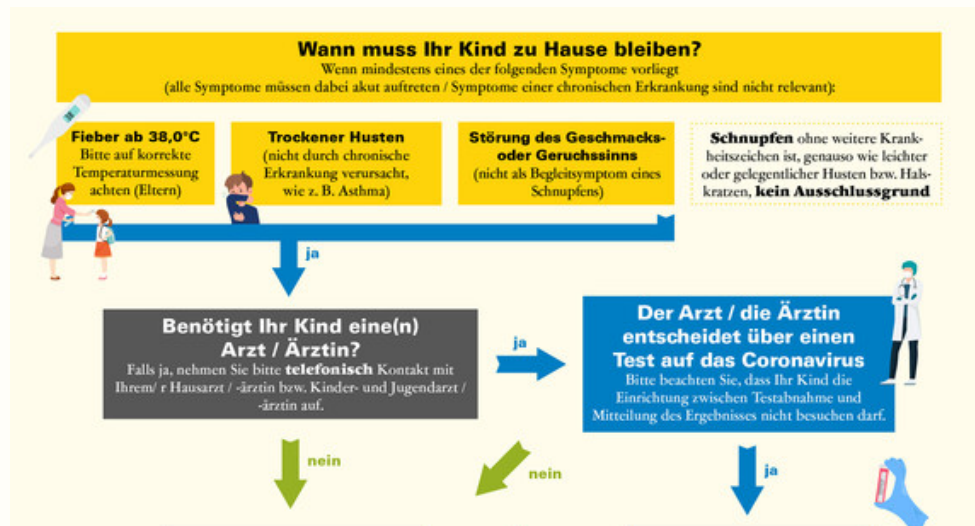
Ministerium für Soziales und Integration