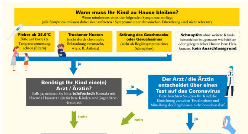
Ministerium für Soziales und Integration