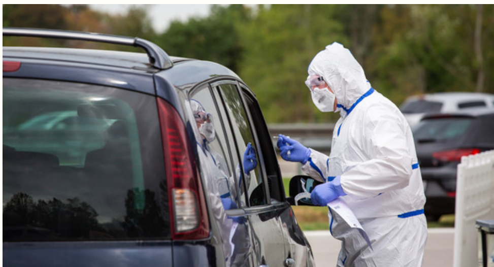
Philipp von Dittfurth/dpa