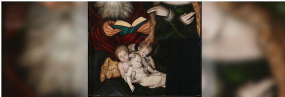
Sammlung Staatliche Kunsthalle Karlsruhe