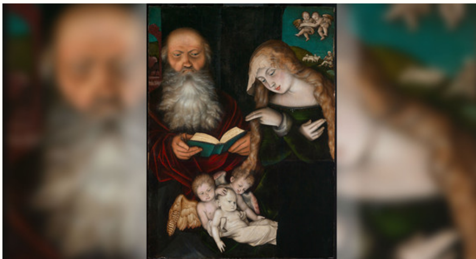
Sammlung Staatliche Kunsthalle Karlsruhe