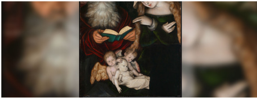
Sammlung Staatliche Kunsthalle Karlsruhe