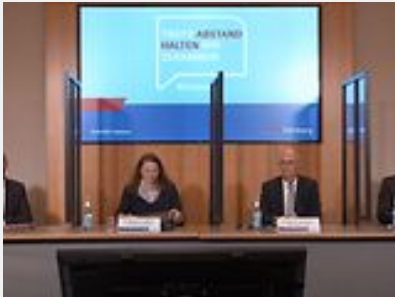
25. August 2020 Landespressekonferenz