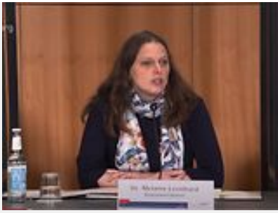
22. September 2020 Landespressekonferenz