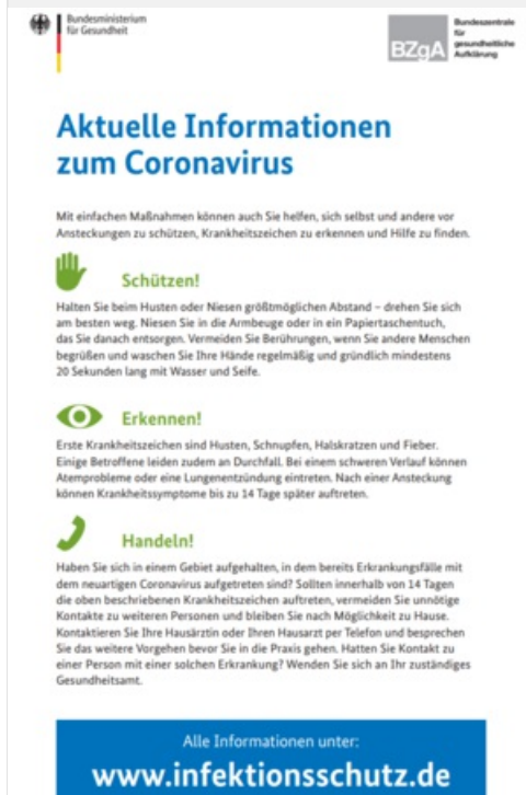
Foto Infoblatt BMG BZgA