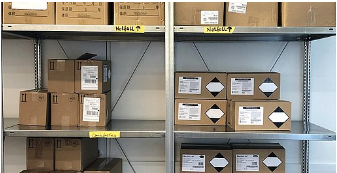
Zentrale Beschaffungsstelle für Schutzausrüstung