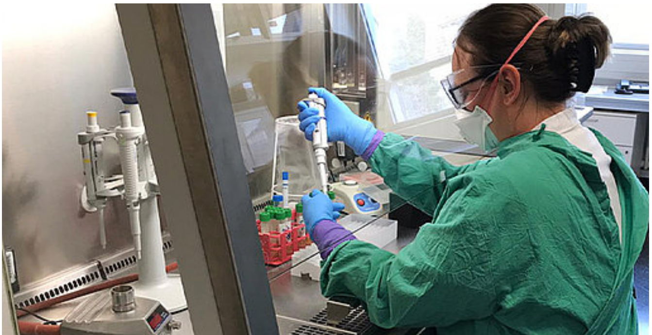
Laborkapazitäten in Thüringen