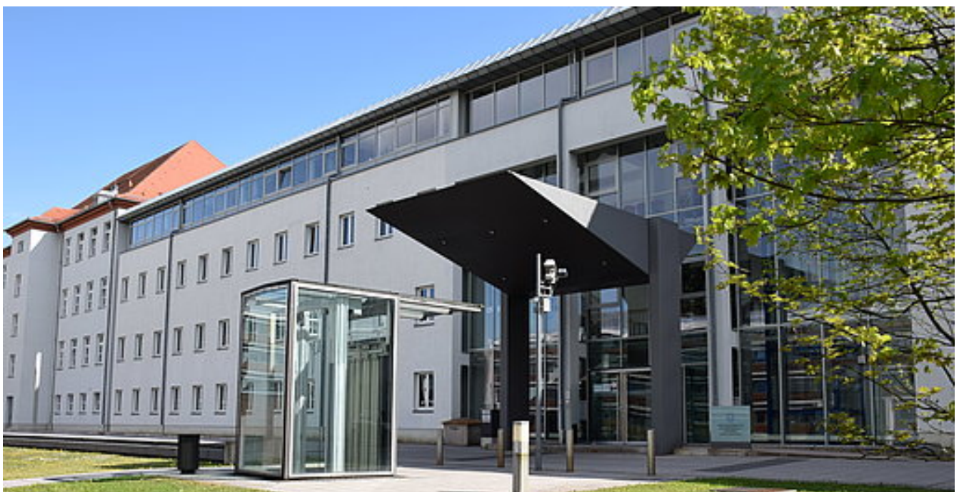
Gesundheitsministerium bei YouTube