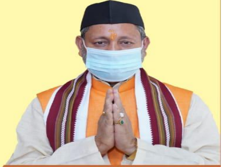
तीरथ सिंह यादव, मुख्यमंत्री

सजग नागरिक बनिये और कोरोना महामारी की लड़ाई में सरकार का साथ दें।