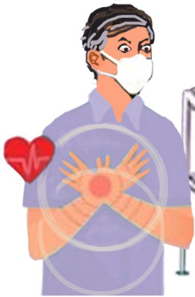
Those with co-morbid condition