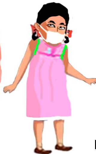
Children (under the age of 10)