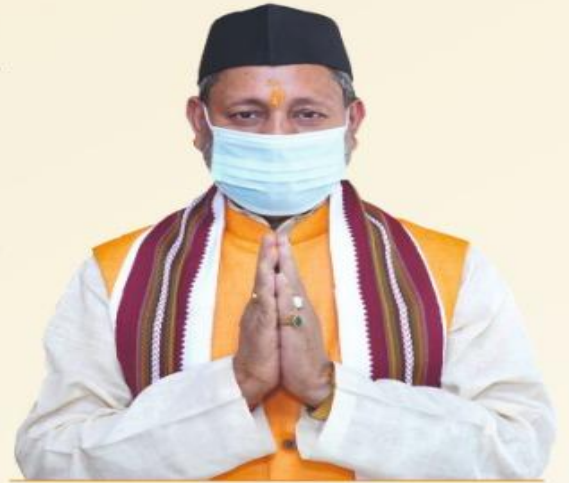
तीरथ सिंह रावत मुख्यमंत्री, उत्तराखण्ड

कृपया सहयोग प्रदान करने के लिए सरकार के निम्न पोर्टल पर अपना पंजीकरण करायें