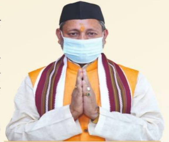
तीरथ सिंह रावत मुख्यमंत्री, उत्तराखण्ड

कृपया सहयोग प्रदान करने के लिए सरकार के निम्न पोर्टल पर अपना पंजीकरण करायें