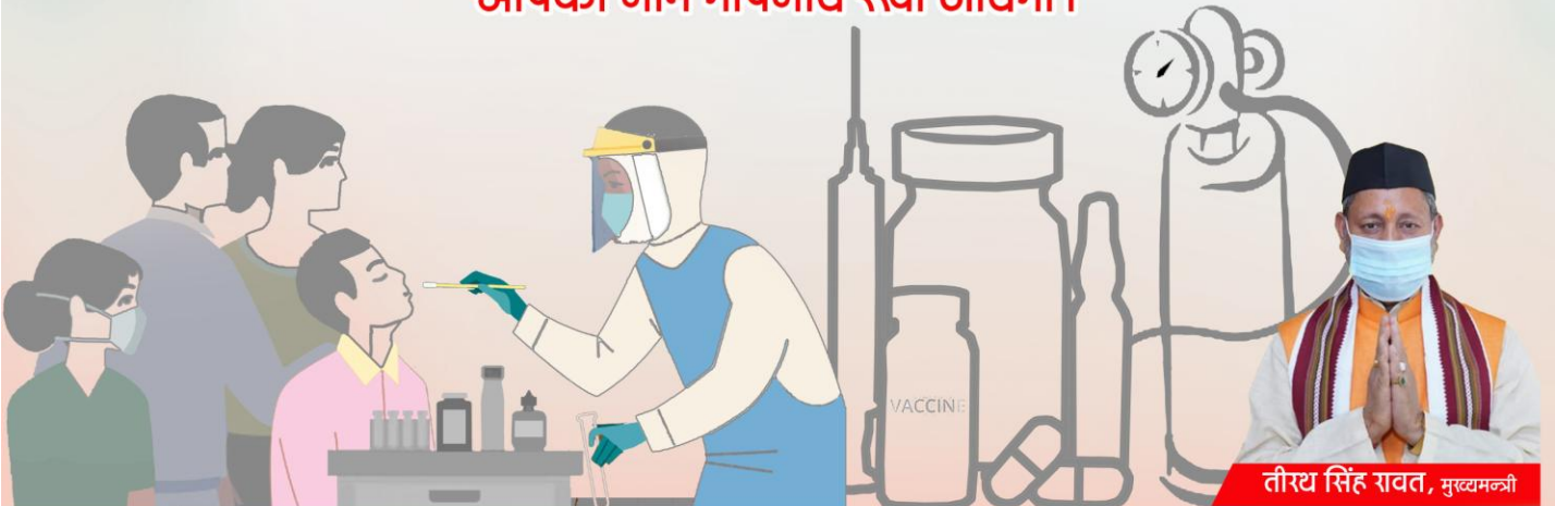
तीरथ सिंह रावत, मुख्यमन्त्री

कोई भी शिकायत करने के लिये टोल फ्री नम्बर-112 0135-2656202 तथा 9412029536 पर सूचित करें आपका नाम गोपनीय रखा जायेगा।