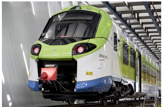
Treni. Il 'Donizetti' debutta domenica sulla linea Milano-Gallarate-Luino