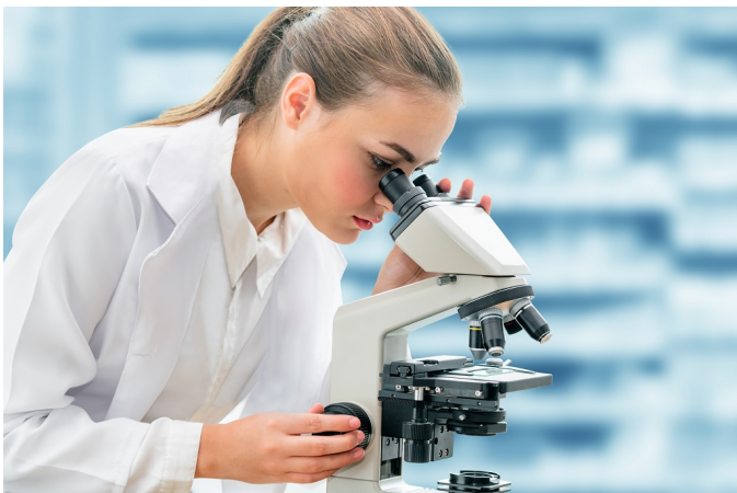
Lombardia guiderà lotta al Covid con nuovo Centro per l'innovazione