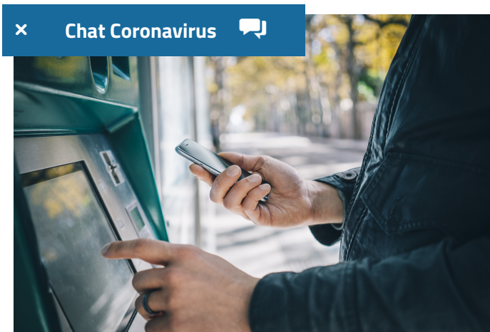
Corsico/MI, assalto a bancomat. De Corato: campo Rom Muggiano da chiudere