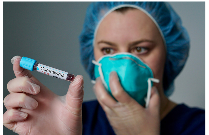
Coronavirus in Lombardia, tutti gli aggiornamenti in diretta - video