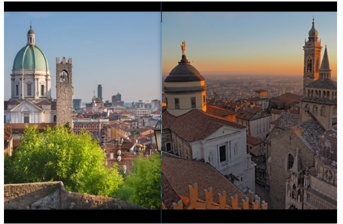
Brescia e Bergamo capitali cultura 2023. Fontana: sostegno di Regione