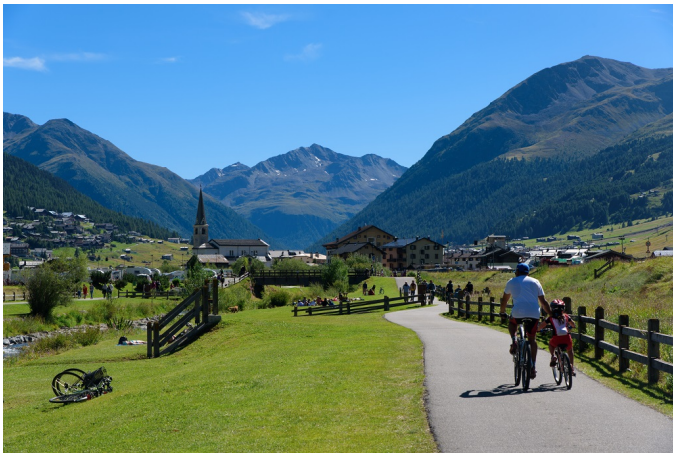
Giornata della Montagna, Sertori: territori in quota perno nostra politica