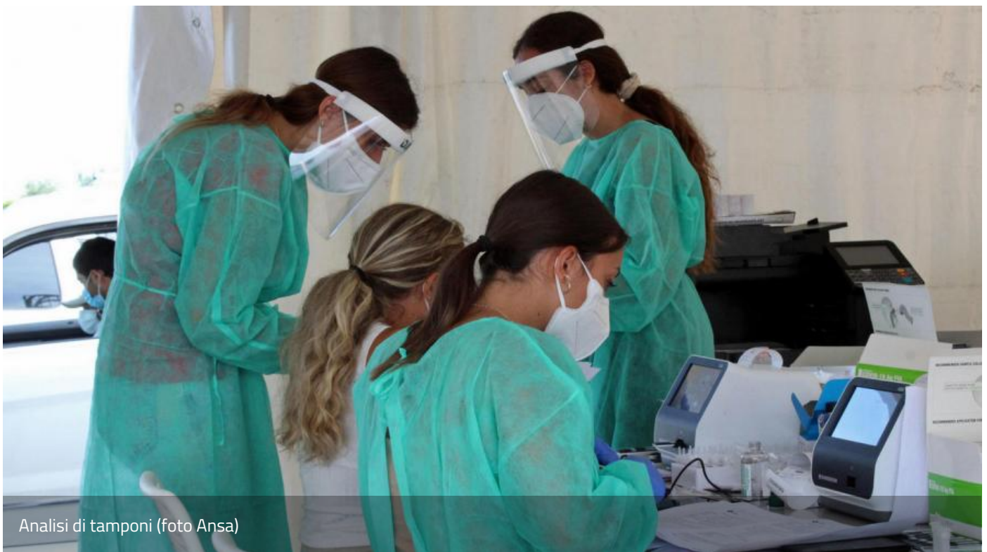
Analisi di tamponi