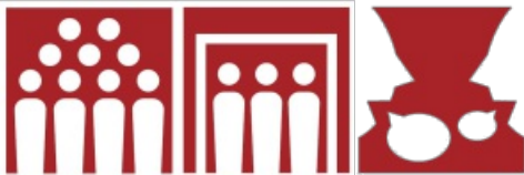
密集回避 密室回避 密接回避

集団感染は、「換気が悪く」、「人が密に集まって過ごすような空間」、「不特定多数の人が接触するおそれが高い場所」という共通点があります。