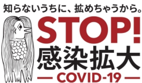
若者の皆さま向け啓発アイコン「アマビエ」