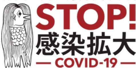
若者の皆さま向け啓発アイコン「アマビエ」