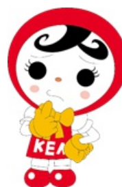
人権イメージキャラクター 人KENあゆみちゃん