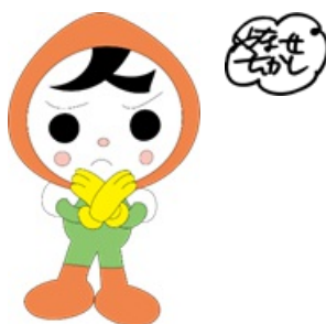
人権イメージキャラクター 人KENまもる君