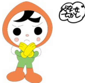
人権イメージキャラクター 人KENまもる君