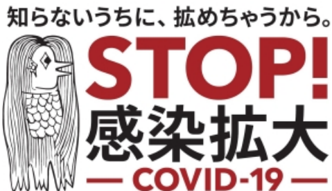
若者の皆さま向け啓発アイコン「アマビエ」