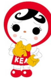
人権イメージキャラクター 人KENあゆみちゃん