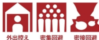
外出控え 密集回避 密接回避