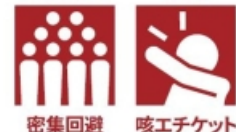
密集回避 咳エチケット