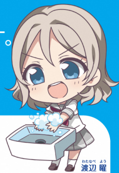
わたなべ よう 渡辺 曜