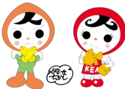
人権イメージキャラクター 人KENまもる君