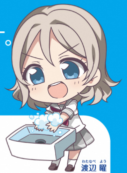
わたなべ よう 渡辺 曜