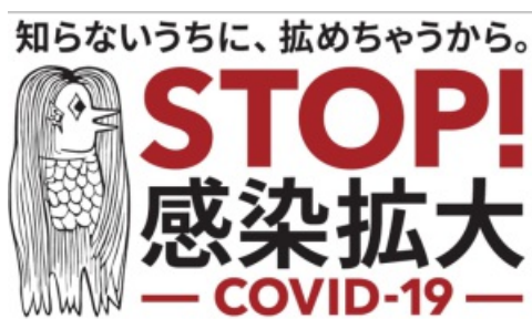
若者の皆さま向け啓発アイコン「アマビエ」