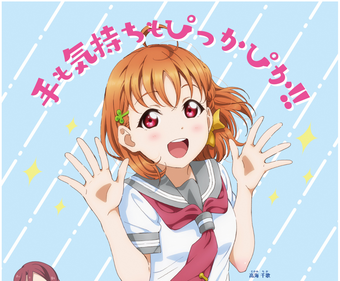
たけみ ちか 高海 千歌

『ラブライブ! サンシャイン!!』に登場するスクールアイドルAqours（アクア）を描いた手洗いポスターを公開しています NEW 株式会社サンライズと協力し、『ラブライブ! サンシャイン!!』に登場するスクールアイドル、Aqours（アクア）による新型コロナウイルス感染症予防の手洗い推進啓発ポスターを公開しました。