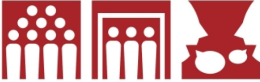
密集回避 密閉回避 密接回避

できるだけ、そのような場所に行くことを避けていただき、やむを得ない場合には、マスクをするとともに、換気を心がけていただく、大声で話さない、相手と手が触れ合う距離での会話は避ける、といったことに心がけてください。