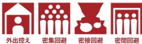
外出控え 密集回避 密接回避 密閉回避

さらにお願ひ: お友達にもぜひ3つのお願いを伝えていただけませんか。以下のロゴをご家庭や学校、職場において自由にお使いください。(6バージョン)