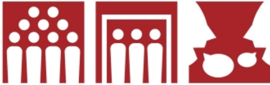
密集回避 密閉回避 密接回避

集団感染は、「換気が悪く」、「人が密に集まって過ごすような空間」、「不特定多数の人が接触するおそれが高い場所」という共通点があります。